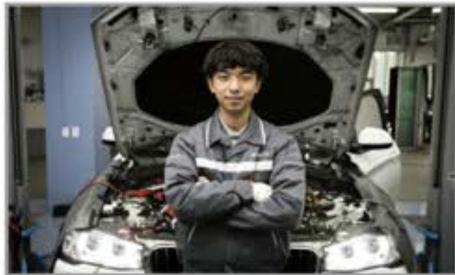
중앙일보 [ 중앙일보 ] 차 엔진이 교과서! 나는 '마스터' 꿈꾸는 19세 자동차 정비사입니다. (2017. 12. 01.)