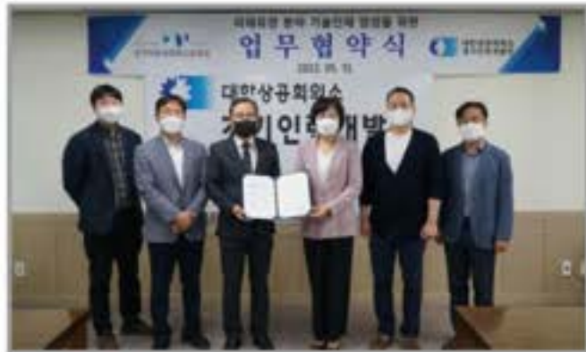
한국일보 [ 한국일보 ] 경기인력개발원 - 경기자동차과학고, 미래유망분야기술인재 양성 업무 협약 체결 (2022. 05. 18.)