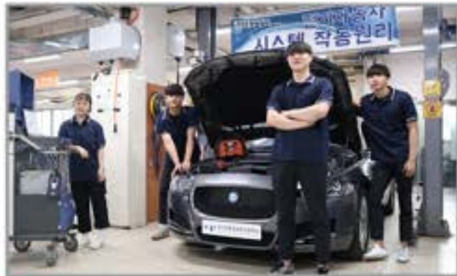
전자신문 [ 전자신문 ] 취업 걱정없는 명품학교 - 경기자동차과학고등학교 (2022. 06. 12.)