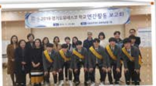
세계와 함께 걸어간다! 유네스코협력학교!