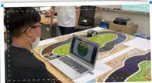
재능 뽐뿌! 실력뽐뿌! GHAS ON 페스티벌!