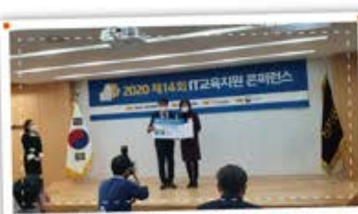
정보의 힘이 미래의 힘! IT 정보교육 우수상 수상!