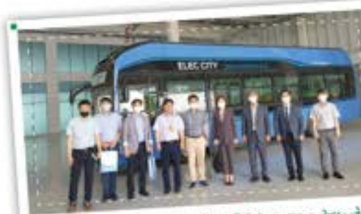
서울대에서 먼저 알아본 자율주행센터 협약회!