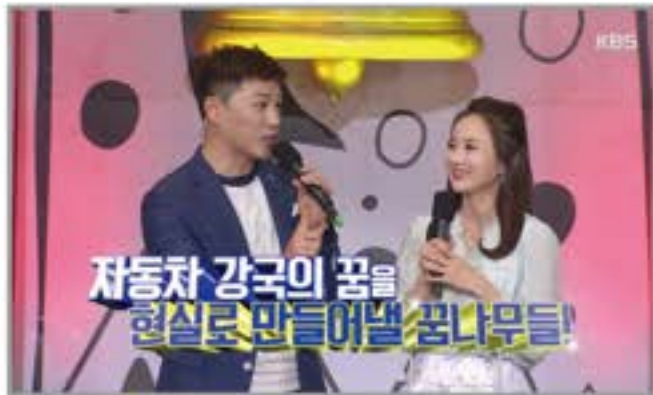
도전 골든벨 [ KBS ] 2TV 도전 골든벨 (2016. 04. 03.)