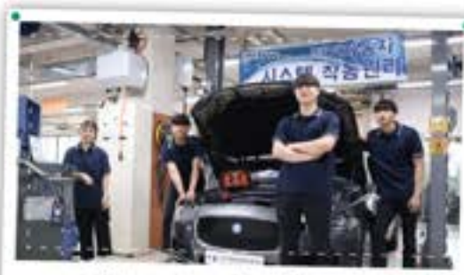
미래자동차라면서 만나세요! 전기자동차!