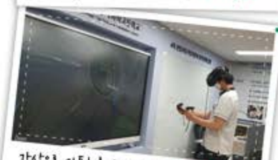
가상으로 자동차를 수리한다! VR/AR 전문가!