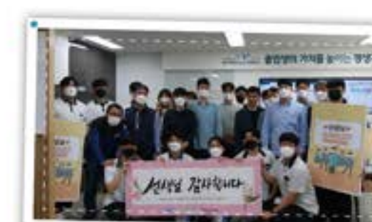
선생님과 나누는 마음! 스승의 날 만남!