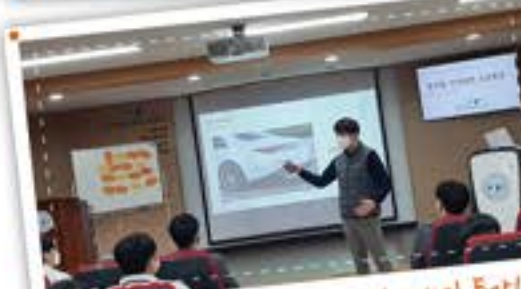
최고의 기업에서 온 특강! 벤츠모바일 특강!