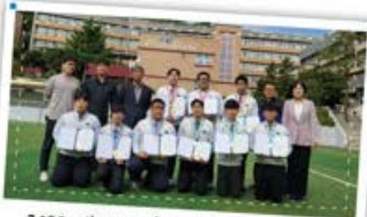
2022 기능경기대회 자동차 부문 최다수상!