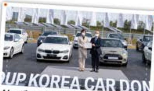
우수 기업이 먼저 신뢰하고 지원! BMW 차량기증!