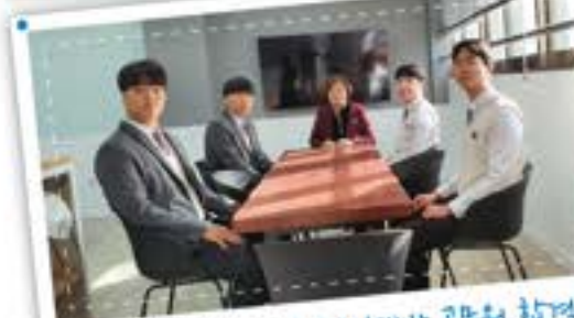
우리는 공무원이야! 미래인재반 공무원 합격!