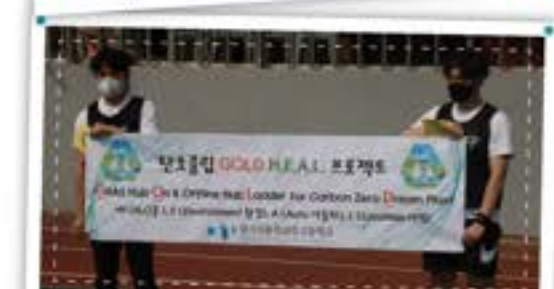
지구를 살리는 탄소중립전시!