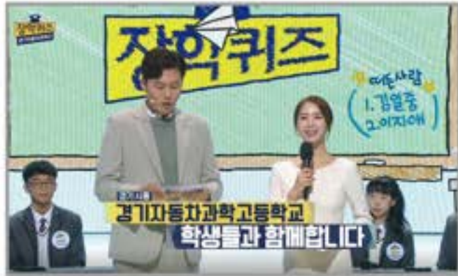
[ 장학퀴즈 ] 장학퀴즈 (2020. 05. 24.) 경기자동차과학고등학교 학생들과 함께합니다