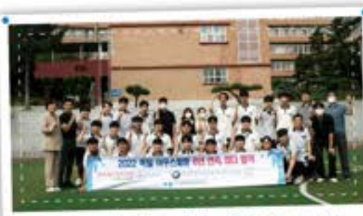
6년간 아우스빌동 전국 최다합격(109명!)