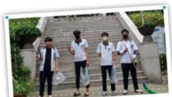
지속가능 환경을 만들자! 플로깅 챌린지!