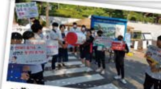
깨끗한 물과 깨끗한 마음! 세계 물의 날!