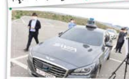
자율주행자동차를 먼저 만나다! K-City 체험!