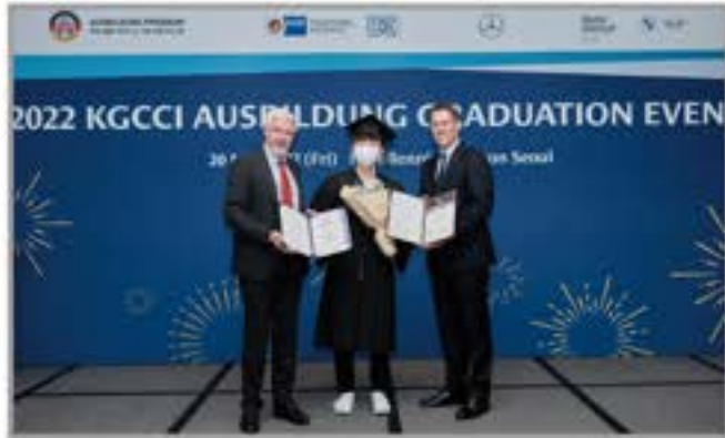
아시아경제 [ 아시아경제 ] 자동차 정비 실무이론 배우는 '아우스빌둥' 첫 졸업생 배출 (2022. 05. 23.)