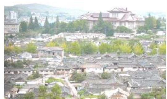
▲개성 한옥 마을: 북한의 한옥 보존 지구로, 외부는 전통 모습을 유지하고 내부는 현대적으로 개조하였다.