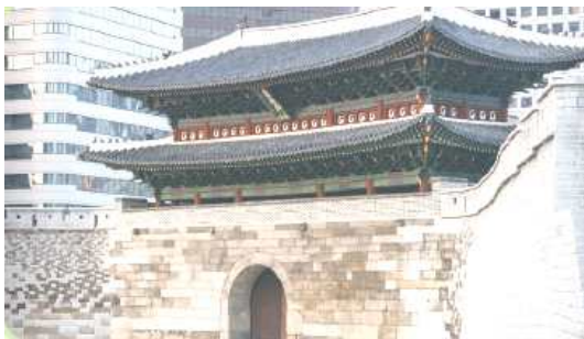
▲송례문: 서울특별시 중구에 있으며, 조선 초기에 세운 목조 건물로 국보 1호이다.