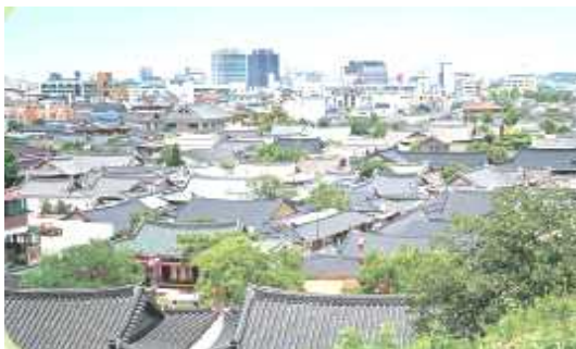
▲전주 한옥 마을: 1997년 한옥 마을 보존 지구로 지정하였으며, 도시 환경에 발맞추어 발전해왔다.