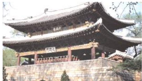
▲대동문: 평양시에 있으며, 장엄함과 아름다움을 동시에 갖추었다고 평가받는 조선 중기 건축물이다.