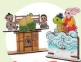
전래동화 오토마타 [9.22.]