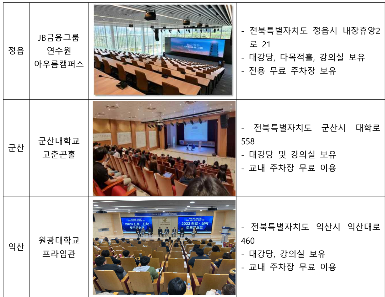
<토크콘서트 장소 섭외 예시>