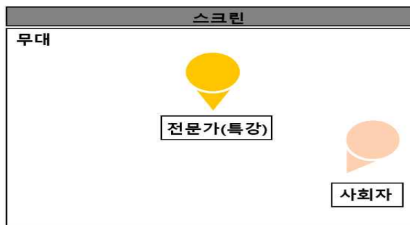
<진로진학 특강 무대 구성>