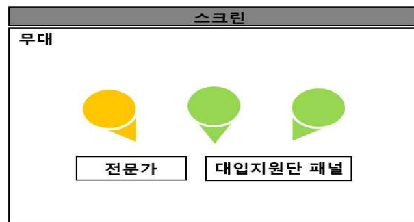
<주제별 토크콘서트 무대 구성>