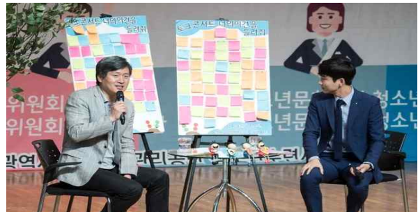
<현장 사전질문 취합 예시>