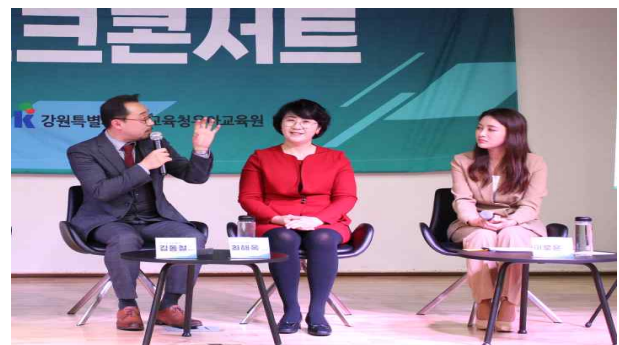
<주제별 토크콘서트 무대 구성 예시>