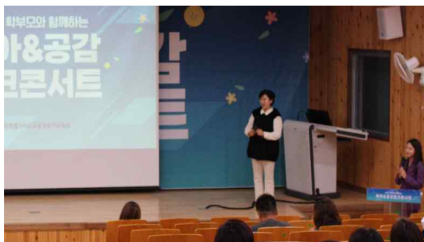
<진로진학 특강 무대 구성 예시>