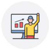
중·장기 계획 및 활용 프로그램 제시