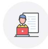
직업포트폴리오 설계 기반

스스로 취업목표를 정하고 목표를 이루기 위해 어떤 활동들을 할 것인지 구체적으로 계획을 세우고 실천하기 위해 작성