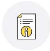
직업탐색 및 심층상담기반

학생이 자신의 목표와 이를 달성하기 위한 중·장기 계획을 충실히 수행하고 관리할 수 있도록 취업에 특화된 개인별 포트폴리오 설계 지원