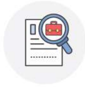
잡케어 활용 진로·직업탐색

개인의 관심 키워드 분석을 통한 맞춤형 AI 직업상담지원서비스 워크넷(work-net)을 통해 수행, 상담시 결과보고서 활용