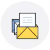
희망 직업 포트폴리오 설계