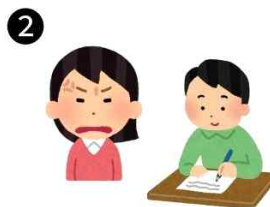
2. 친구들이 왼손잡이인 자신을 불편해하는 상황