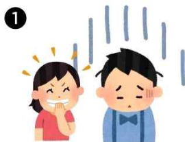
1. 시골에서 전학 와 사투리를 쓰면 친구들이 웃는 상황

1. 다양성을 존중하지 않는 상황을 한 가지 골라 ‘어기역차’를 적용해 봅시다.