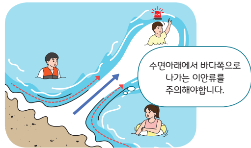
< 이안류(거꾸로 치는 파도) >

** 수면아래에서 바다 쪽으로 나가는 강한 역류성 흐름(최고 3m/sec).