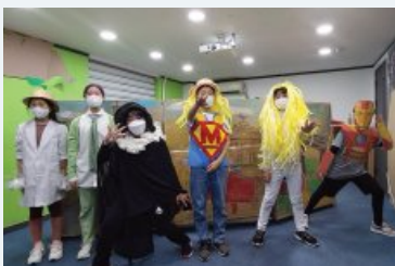
초등학교 대상 (총사업)