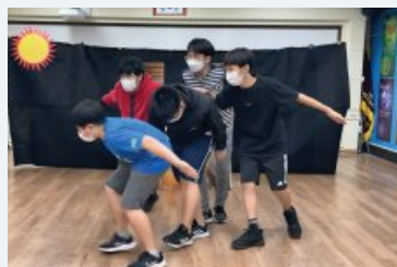
중학교 대상 (온라인 온라인업)