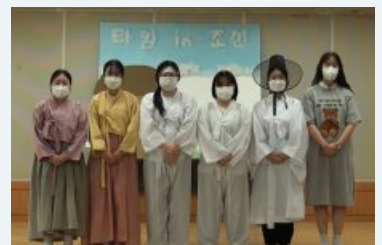
고등학교 대상 (타임 in 조선)