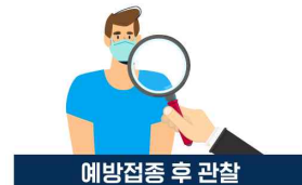
예방접종 후 관찰