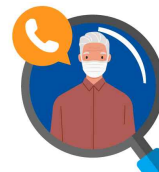
이상반응 발생이 의심되는 경우