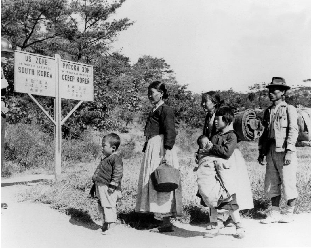
38도선을 통과하는 사람들