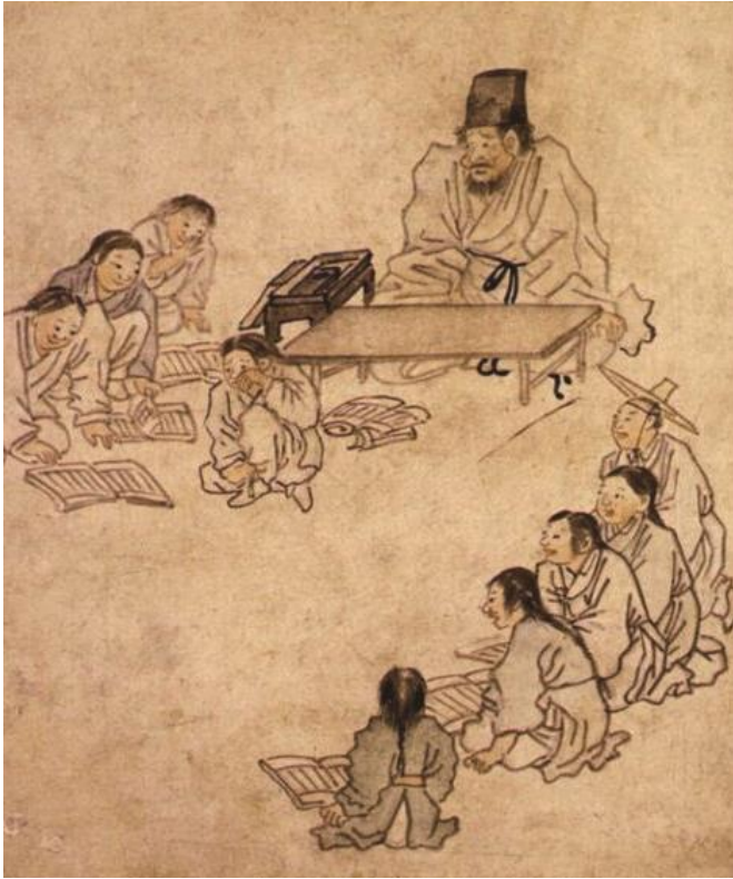
18세기 조선 시대 화가 김홍도가 그린 「서당」

과거와 오늘날의 교육 활동은 여러 가지 측면에서 달라서 문화의 변동성을 잘 보여 준다. 먼저 교육 공간이 서당에서 학교로 바뀌었고, 교육 수단도 책뿐이던 상황에서 다양한 매체로 확장되었다. 또한, 과거에는 교사(훈장)와 학생의 관계가 엄격한 수직적 관계였지만, 오늘날에는 상호 존중이 요구되고 있다. 그리고 서양식의복을 주로 입고 일반적으로 상투를 틀지 않는 오늘날과 달리 18세기에는 모든 사람이 한복을 입었고, 훈인을 하면 상투를 틀었다.