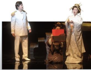
오페라 '나비 부인'의 한 장면. 동양은 약하고 보호받아야 하는 존재로 보고, 서양은 강하고 우월한 존재로 보는 오리엔탈리즘이 나타난다.

오리엔탈리즘(Orientalism)이란 유럽이 동양과 서양을 문맹과 문명, 야만과 지성으로 나누는 이분법적인 사고 틀을 말한다. 오리엔트라는 말이 들어가 있지만 동양은 오리엔탈리즘의 주체가 아니다. 오리엔탈리즘은 철저하게 서양의 관점에서 바라본 동양에 대한 이미지이다. 서양의 관점에서 동양은 미지의 신비로운 곳이며, 문명화되지 않은 야만 사회이다. 따라서 더 합리적이고 이성적인 서구 문명이 미개한 동양을 문명화시키고 지배하는 것이 정당화된다. 서양의 문학, 예술, 영화 등에서 동양은 아름답고 신비롭지만, 야만스럽고 이상하게 묘사된다. 문제는 이러한 동양에 대한 서양의 편견이 서양의 대중문화를 통해 동양에 그대로 이식된다는 점이다.