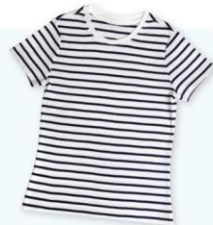
'줄무늬'보다 '스트라이프'라는 표현을 선호하는 이유는 무엇일까?

같은 옷이라도 영어로 표기하면 더 비싸게 인식되는 것으로 나타났다. 한 의류 디자인학과 연구팀은 우리나라 20대 소비자를 대상으로 패션 용어 표기에 따른 소비자 반응 차이를 분석하였다. 연구진은 순 한글로 표기한 상표, 외래어를 한글로 표기한 상표, 영문자로 표기한 상표를 각각 주고 예상 가격을 물었다. 그 결과 소비자들은 '편한 검정 면바지'보다는 '블랙 코튼 이지 팬츠'를, 또 그보다는 'black cotton easy pants'의 가격을 더 높게 평가하였다. 또한, 검정보다 블랙, 줄무늬보다는 스트라이프가 '신뢰감 있는', '고급스러운', '세련된' 등의 감성 점수가 높았다.