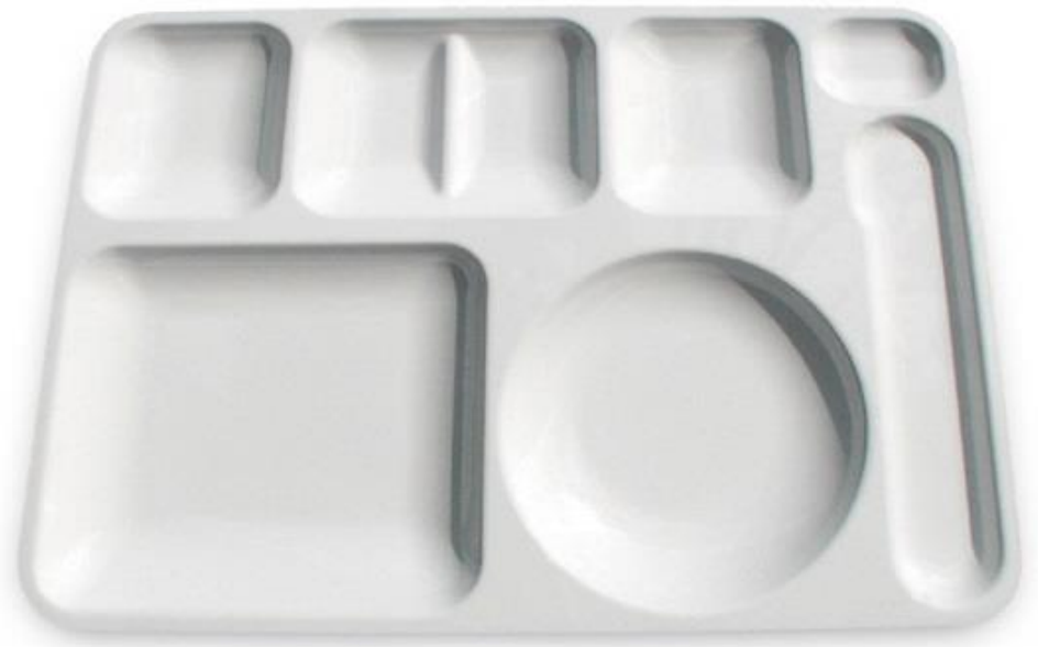
👉 내가 먹은 아침 또는 점심