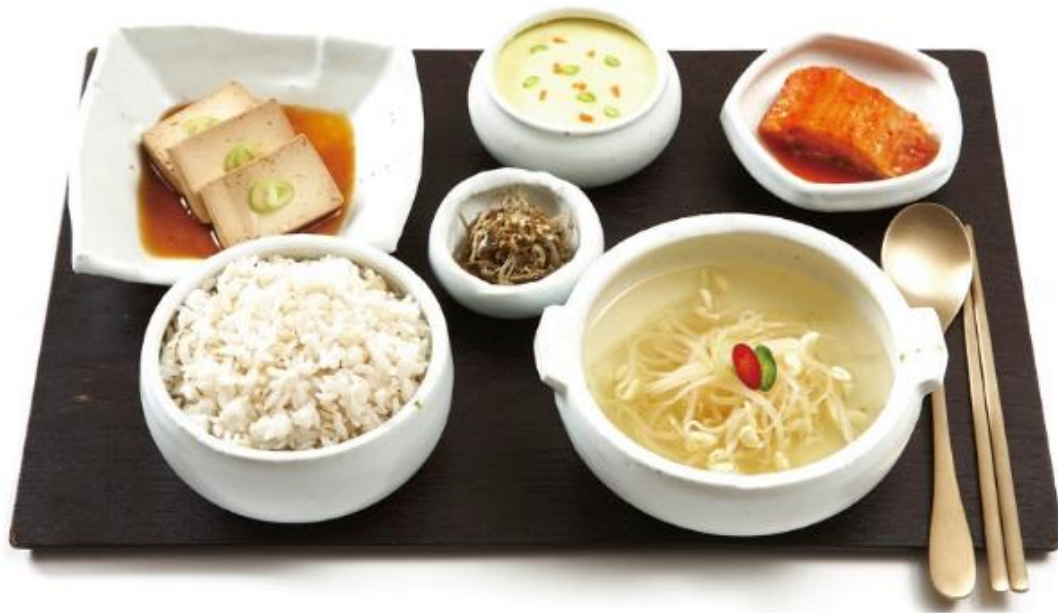
👉 우리나라의 기본 밥상