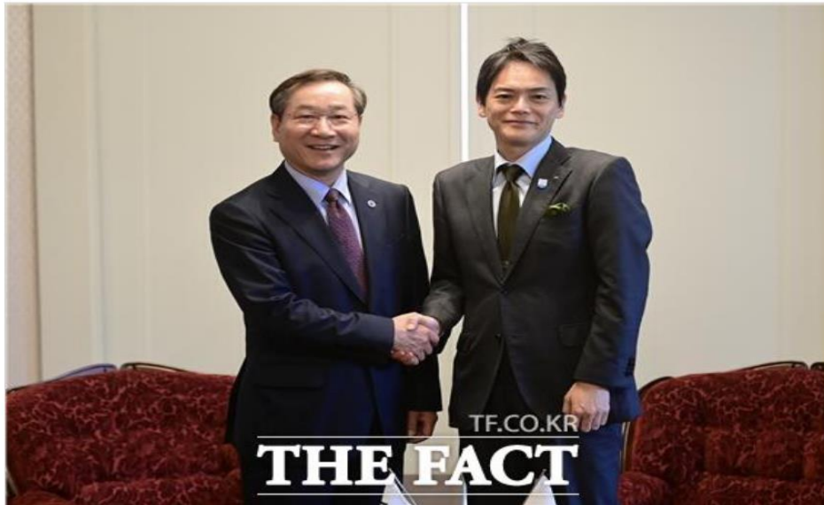
유정복(왼쪽) 인천시장이 31일 일본 요코하마시장 관저에서 야마나카 다케하루(오른쪽) 요코하마 시장과 양 도시 간 우호협력 방안을 논의하고 기념촬영을 하고 있다.