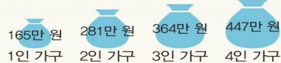
급여별 선정 기준