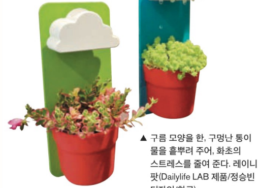
▲ 구름 모양을 한, 구멍난 통이 물을 흘려주어, 화초의 스트레스를 줄여 준다. 레이니 팻(Dailylife LAB 제품/정승빈 디자인/한국)

인간을 위한 디자인(유니버설 디자인) '모든 사람들을 위한 디자인'으로 연령과 성별, 국적과 문화적 배경, 장애의 유무 등에 상관없이 처음부터 누구에게나 공평하고 사용하기 편리한 제품 및 사용 환경의 디자인을 말한다. 그린 디자인(에코 디자인) 환경 친화적 디자인이라고도 불린다. 산업화의 산물인 제품이 자연 생태계에 더 이상 피해를 주지 않으면서 자연의 순화 과정에 순응할 수 있도록 하는 디자인이다.