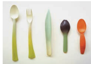
폴리락트산(PLA, polylactic acid)에서 힌트를 얻었다. 폴리락트산은 토양에서 100% 분해되는 소재로, 옥수수나 사탕수수 등 식물에서 추출해 낸 원료다. 덩치원(邓绮云/1989~/중국) 접목(폴리락트산/2013년)

인간을 위한 디자인(유니버설 디자인) '모든 사람들을 위한 디자인'으로 연령과 성별, 국적과 문화적 배경, 장애의 유무 등에 상관없이 처음부터 누구에게나 공평하고 사용하기 편리한 제품 및 사용 환경의 디자인을 말한다. 그린 디자인(에코 디자인) 환경 친화적 디자인이라고도 불린다. 산업화의 산물인 제품이 자연 생태계에 더 이상 피해를 주지 않으면서 자연의 순화 과정에 순응할 수 있도록 하는 디자인이다.