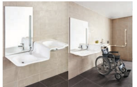
장애나 연령에 상관없이 누구나 편하게 사용할 수 있도록 디자인 된 세면대이다. 세턴-유니버설 세면대(액상 아크릴 수지/2014년/20PLUS 제품/한국)