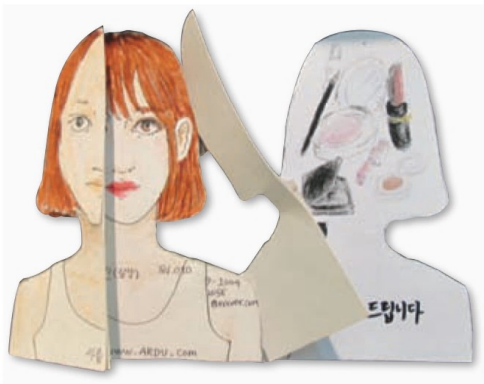
송영아(학생 작품) 메이크업숍 명함 (종이에 색연필과 펜/높이 11cm/2016년)

내가 꿈꾸는 직업을 상징할 수 있는 이미지와 내용을 담아 명함을 디자인해 보자.