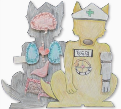
정숙명(학생 작품) 병원 명함 (종이에 색연필과 펜/높이 15cm/2016년)