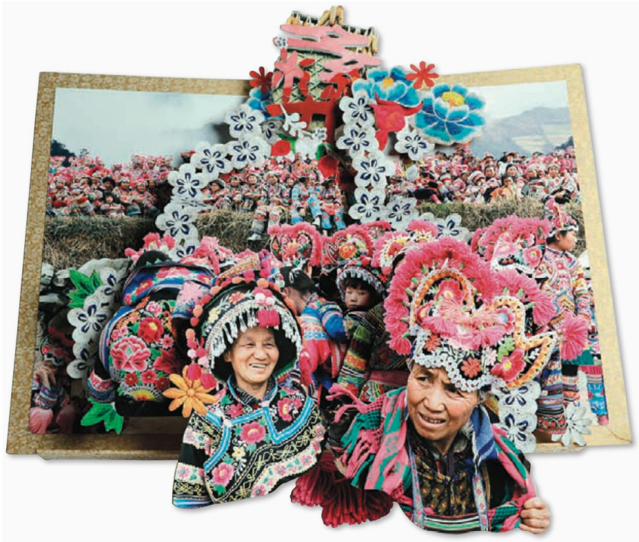
책 디자인 푸(Fu, Colette/1965~/미국) 중국 이족(彝族) 전통 의상 축제 (사진 콜라주 팝업북/펼쳤을 때 81.3×78.7×22.9cm/2008년)