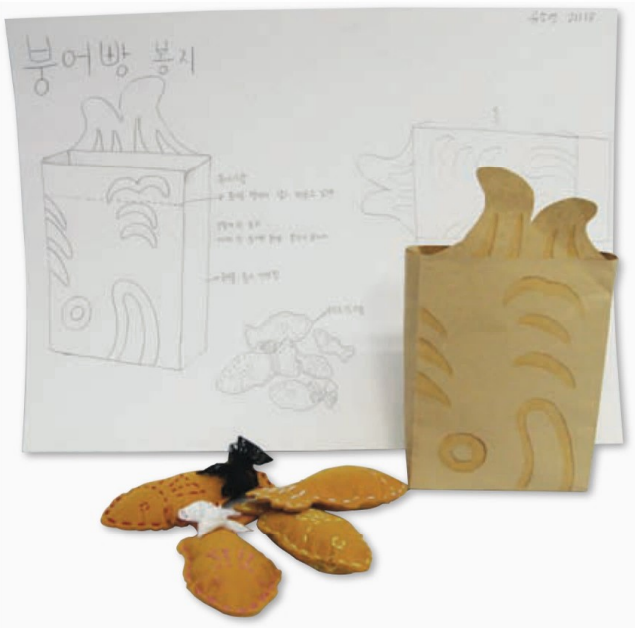
유소영(학생 작품) 붕어빵 봉지 디자인(종이, 펠트/45x25x10cm/2014년)