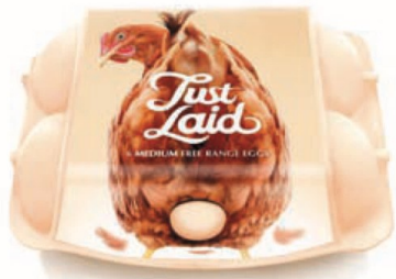
패키지 디자인 달걀을 넣고 있는 닭의 모습을 담아 갓 낳은 달걀이라는 인상을 주며 싱싱함을 강조한다. 저스트 레이이드(Just Laid) 달걀 패키지 디자인(2014년/Springetts 디자인/영국)

시각 디자인은 알리고자 하는 내용을 시각적인 기호나 형태, 색채 등을 통하여 효율적으로 전달하는 디자인이다. 과거에는 주로 인쇄 매체에 의존했으나, 현대 사회에서는 TV, 컴퓨터의 등장으로 영상 매체와 전시회, 박람회 같은 입체 공간의 이미지 관리를 위한 시각 전달 영역까지 그 범위가 확대되고 있다.