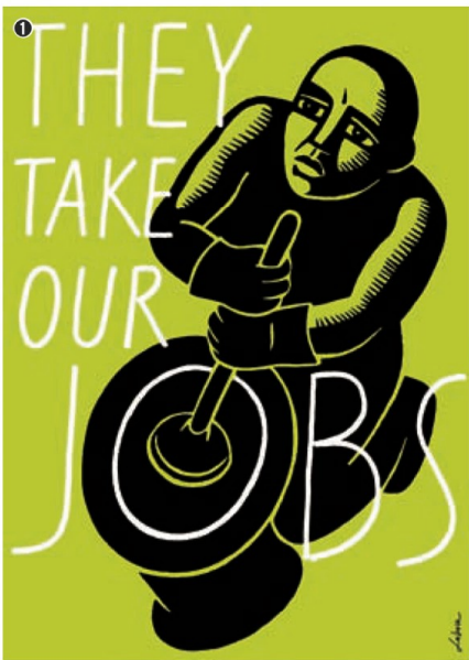
❶ 포스터 디자인 루코바는 포스터 디자인을 통해 사회적, 정치적 문제에 대해 얘기한다. 이 포스터는 이민자 문제를 다루고 있다. 루코바(Lukova, Luba/1960~/불가리아→미국) 그들이 우리의 일자리를 가져간다(디지털 작업/2009~2012년) ❷ 전시 디자인 《팀 버튼》 전시 전시장 입구(2012~2013년/서울시립미술관)