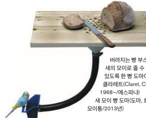
버려지는 빵 부스러기를 새의 모이로 줄 수 있도록 한 빵 도마이다. 클라레트(Claret, Curro/1968~/에스파냐) 새 모이 빵 도마(도마, 호스, 모이통/2013년)