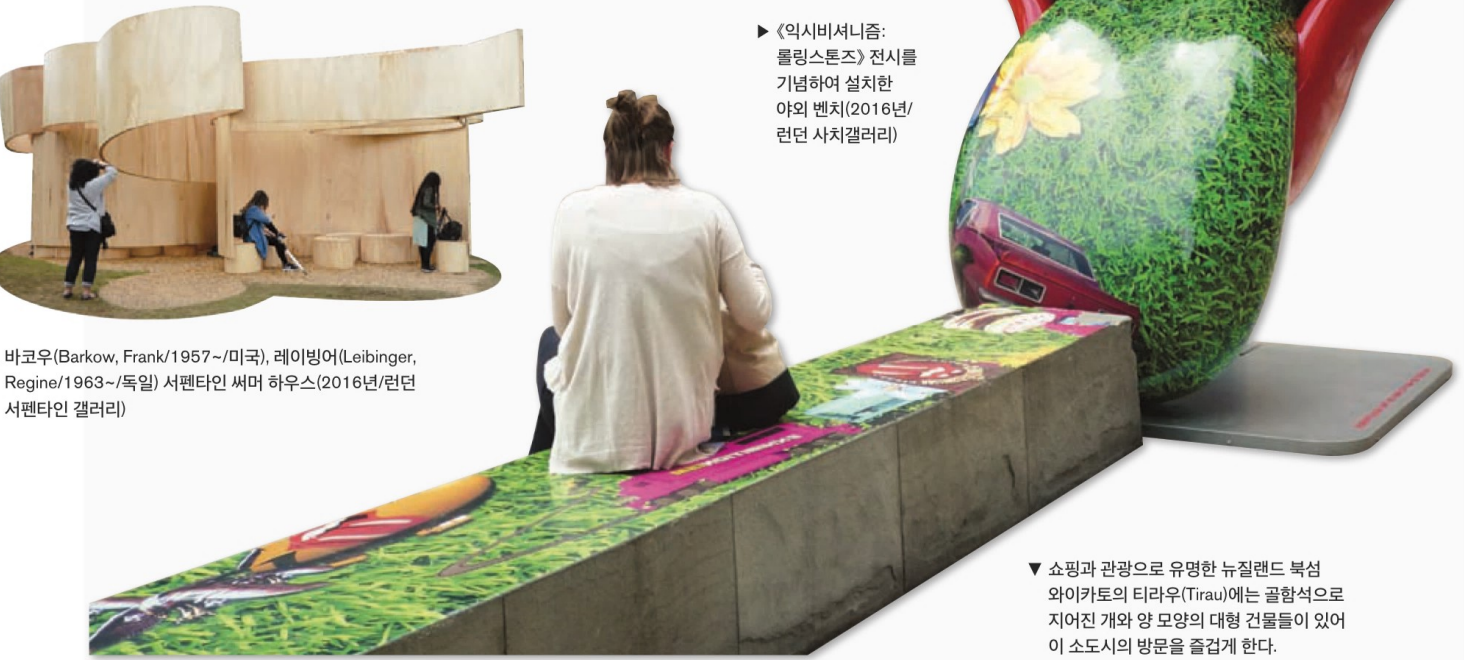
▶ 《악시비서니즘: 롤링스톤즈》 전시를 기념하여 설치한 야외 벤치(2016년/런던 사치갤러리)

환경 디자인은 크게는 국가, 도시 계획에서부터 작게는 개인 주택의 실내 디자인에 이르기까지 다양하다. 환경 디자인의 하나인 공공 디자인은 사회 구성원 누구나 누리는 공공성에 보다 중점을 둔 디자인으로, 국가 및 지역의 상징성, 역사적 전통과 문화를 반영하며 경제, 사회, 문화적 가치를 창출하기도 한다. 공공 디자인에는 벽화, 스트리트 퍼니처 등이 있다.