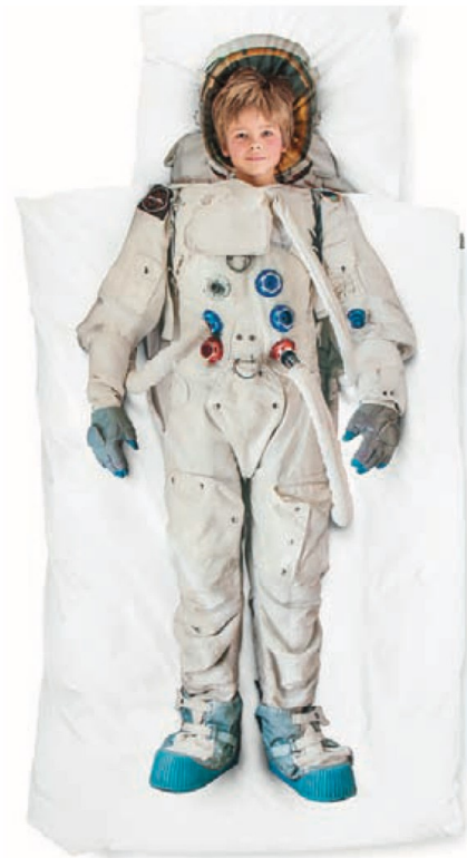
◀ 시각적 효과가 돋보이는 침구 디자인이다. 우주 비행사 이불(Snurk 제품/네덜란드)

제품 디자인은 우리 생활에 필요한 물건들을 쓸모 있는 기능과 형태, 합리적인 가격으로 대량 제작하여 생활의 질적 향상과 생활 개선을 목적으로 한다. 기계에 의해 대량 생산되므로 공업 디자인 또는 산업 디자인이라고도 한다.