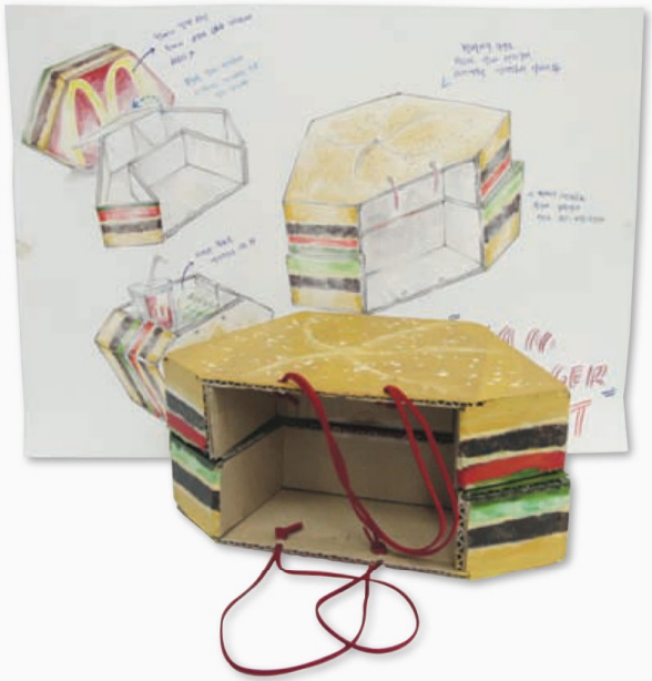
한민희(학생 작품) 햄버거 패키지 디자인(종이, 끈/20x45x30cm/2014년)

먹거리를 담을 수 있는 패키지를 다양하게 생각하여 창의적으로 만들어 보자.