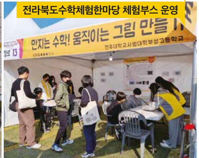
전라북도수학체험한마당 체험부스 운영