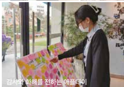
감사와 화해를 전하는 애플데이