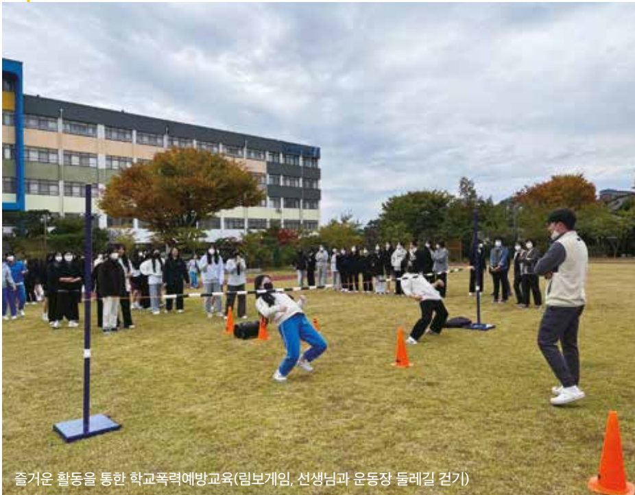
즐거운 활동을 통한 학교폭력예방교육(림보게임, 선생님과 운동장 돌레길 걷기)