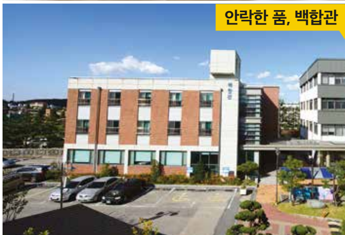
안락한 품, 백합관