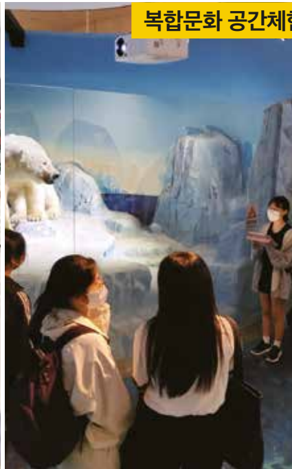
복합문화 공간체험에서 펼쳐지는 진로프로그램