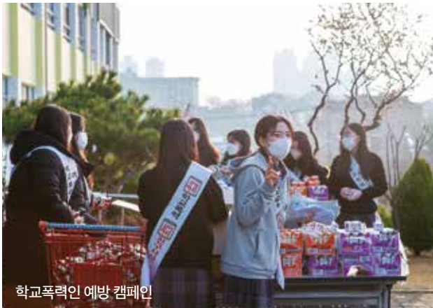
학교폭력인 예방 캠페인