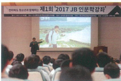
제1회 군산 중앙고