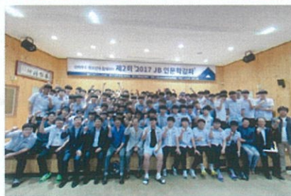
제2회 전주 동암고