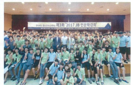
제3회 익산 원광고