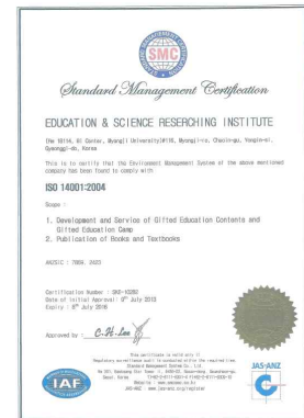
ISO 14001 국제캠프인증