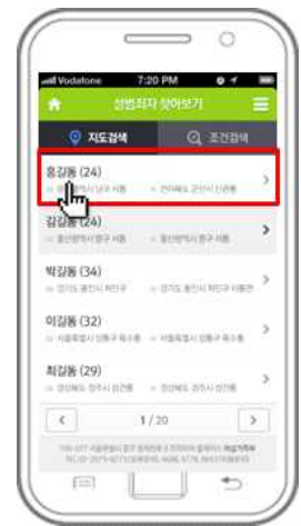
④ 성범죄자 확인

가. 조회할 수 있는 성범죄자 신상정보 : 성명, 사진, 나이, 신체정보, 실제거주지, 전자장치 등 나. 알림기능으로 설정 : 자신의 위치를 기반으로 거주하는 성 범죄자를 음성과 메시지로 제공 받고 확인할 수 있습니다.