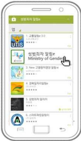
① 앱스토어에서 '성범죄자 알림e' 앱 검색