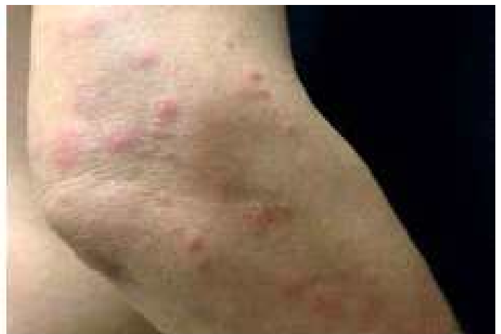
<빈대에 물린 자국>