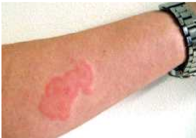
<빈대에 물린 자국>