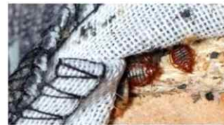
<매트리스에서 발견된 빈대>

( https://news.sky.com/story/bed-bugs-eurostar-on-a-lert-as-paris-grapples-with-infestation-12977030 )