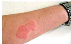
<빈대에 물린 자국>

주로 옷에 가려지지 않은 팔, 손, 목, 다리 등 노출부위를 물며 혈관을 잘 찾지 못해서 2~3곳을 연달아 물어 일렬이나 원형으로 자국이 생깁니다.