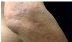
<빈대에 물린 자국>