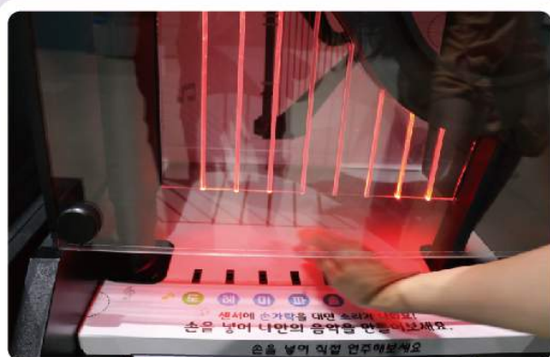
소리 속 과학을 찾아라