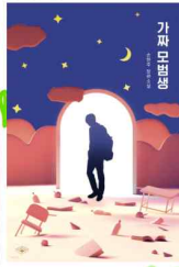
가짜 모범생 손현주 / 특별한서재

전교 1등 영재 코스만 밟아오던 쌍둥이 형이 스스로 목숨을 끊은 뒤, 엄마의 집착은 동생 선위에게 옮겨갔다. 자식이 우울증을 겪더라도 '1등'이라는 '완벽함'만 유지할 수 있다면 신경 쓰지 않는 엄마의 비뚤어진 관심 아래에서 선위는 자신도 형처럼 되지 않을까 불안해 한다. 성적 지상주의가 만연한 사회에서 청소년들이 성적보다 중요한 것이 무엇인지, 자신만의 길을 헤쳐나가는 데 필요한 공부는 무엇인지 고민해 보게 되는 책이다.