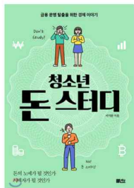
청소년 돈 스테디 서지원 / 책담

돈에 대해 모르는 사람은 없다. 돈을 싫어하는 사람도 없다. 그러나 돈에 대해 정확하게 잘 아는 사람은 그다지 많지 않다. 한국의 문맹률은 1%이하이지만 돈 관리법을 모르는 금융 문맹률은 세계 최고 수준! 돈을 배운다는 것은 부자가 되는 법을 배우는 게 아니다. 금융을 제대로 이용하고, 돈을 잘 관리하며, 합리적으로 소비해서 위기에 빠지지 않는 법을 배우는 것이다.