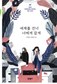
세계를 건너 너에게 갈게