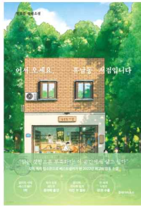
어서오세요, 휴남들 서점입니다