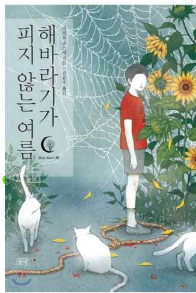
해바라기가 피지 않는 여름