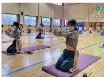
특성화 교과 (국선도)