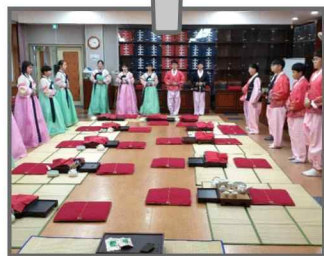
특성화 교과 (다도)