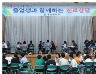
졸업생 진로 멘토링