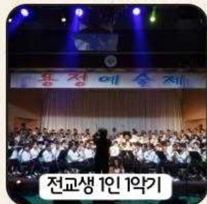
전교생 1인 1악기