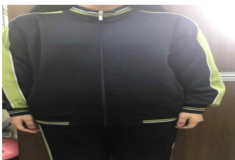
동복 - 전면