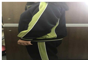
동복 - 측면