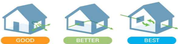
[자연환기 방식별 환기효과 비교]