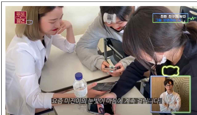
TV예능 <연애의 참견> 패러디 <푸코의 참견>(2"03)