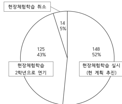
테마식현장체험학습 학생 희망조사