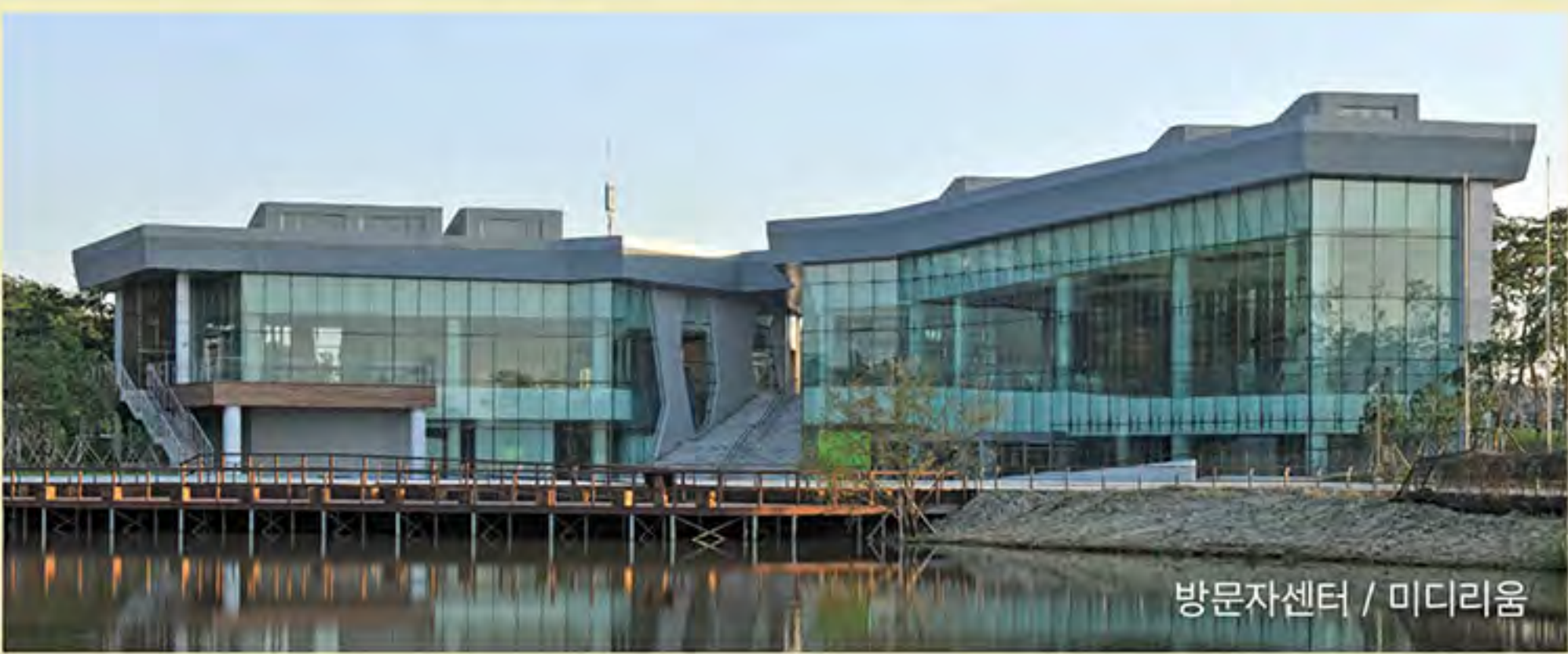
방문자센터 / 미디어룸