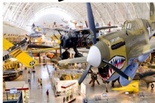
항공우주박물관 / 자연사박물관 / 소미니언 박물관