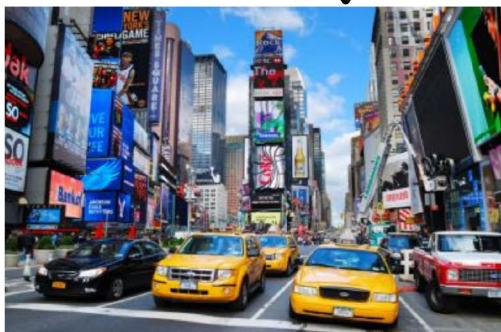
뉴욕, 워싱턴D.C, 보스턴 자유의 여신상 / 원월드 전망대