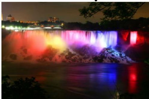
나이아가라폭포 미국 & 캐나다 사이드