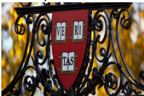
하버드&예일&코넬&프린스턴 현지 대학생 인터뷰 및 미션활동