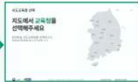
해당 시·도 선택