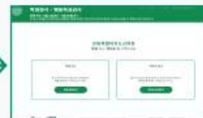
학생참여하기 버튼 클릭

※ 검사 대상 : 중학교 1학년 고등학교 1학년(학생이 직접 참여합니다.)