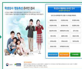
해당 시·도 선택