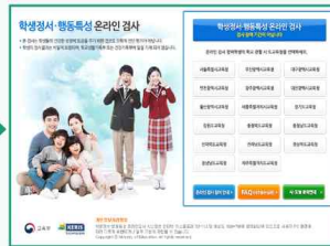
해당 시·도 선택