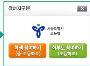
학생 참여하기 버튼 클릭

※ 검사 대상 : 중학교 1학년, 고등학교 1학년(학생이 직접 참여합니다.)