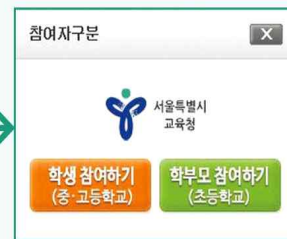
학생 참여하기 버튼 클릭