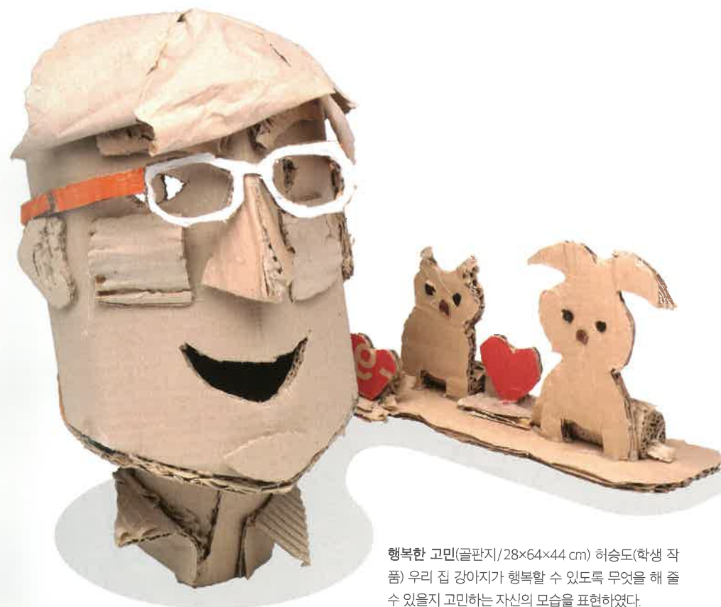
행복한 고민(골판지/28×64×44 cm) 허승도(학생 작품) 우리 집 강아지가 행복할 수 있도록 무엇을 해 줄 수 있을지 고민하는 자신의 모습을 표현하였다.