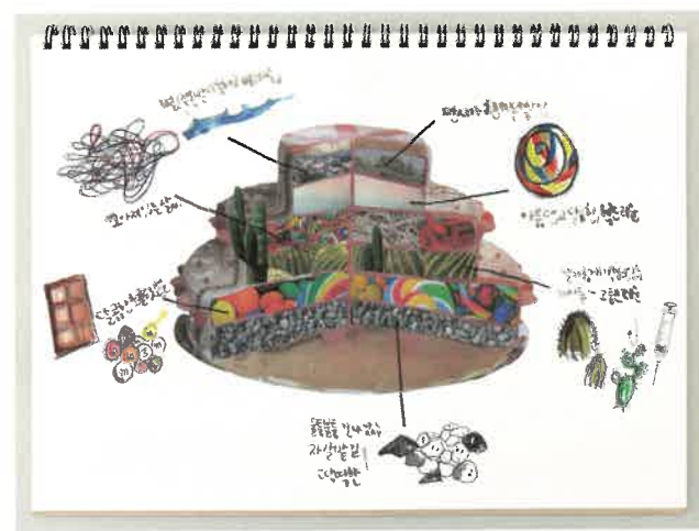
프로세스 폴리오 작품을 제작하는 과정을 담아 프로세스 폴리오로 만들었다.