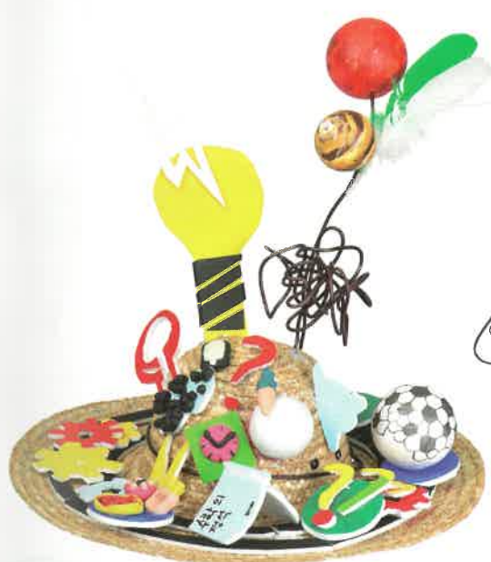
꿈을 향한 나의 생각들(밀집모자에 우드록, 혼합 재료/48×48×60.4 cm) 공선우(학생 작품) 천문학과라는 꿈을 이루기 위해 열심히 공부하는 자신을 표현하였다.

● 나의 고민이나 꿈, 생각을 적어 보고 상징하는 물건을 찾아 수집하여 나를 표현해 보자.