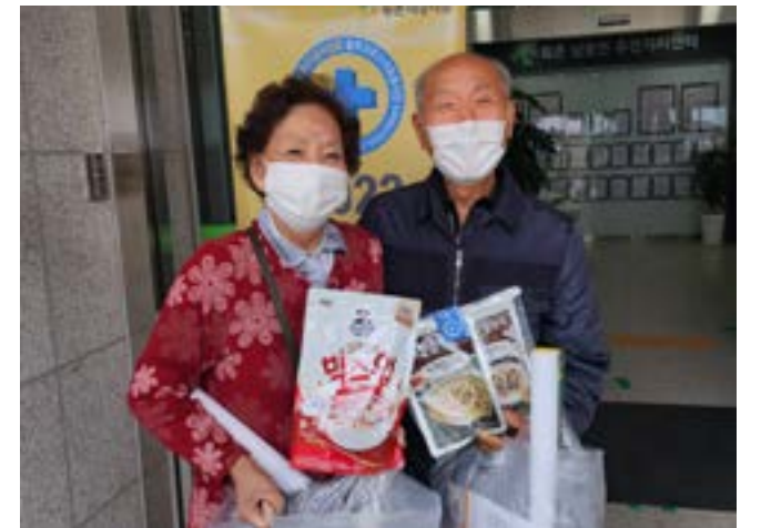
수해지역 물품지원_롯데제과, 대상주식회사(2022.10.10)