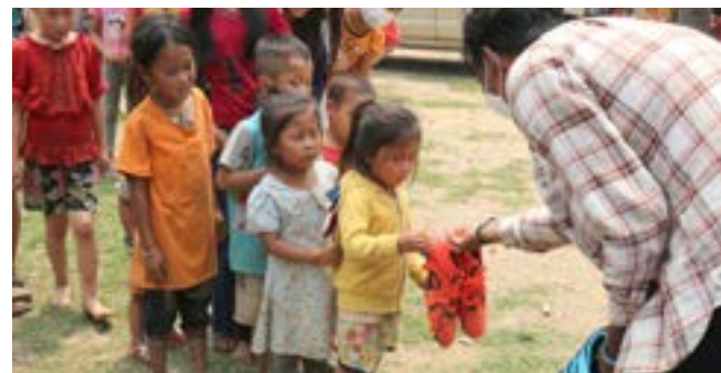
라오스 어린이들에게 드림축구화 전달모습(2022.04.09)