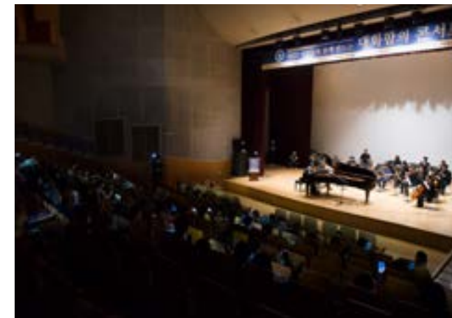
대화합의 콘서트 공연모습(2022.10.01)

기간 2022년 제6~8차까지 장애인 토크콘서트 릴레이 진행 (2022년 직접 참가자 1,500명, SNS를 통한 간접 참가자 10,000명 이상 추정)