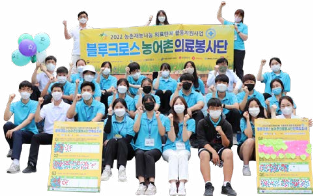
제3차 강원도 횡성군 의료봉사활동 후 단체사진(2022.06.05)