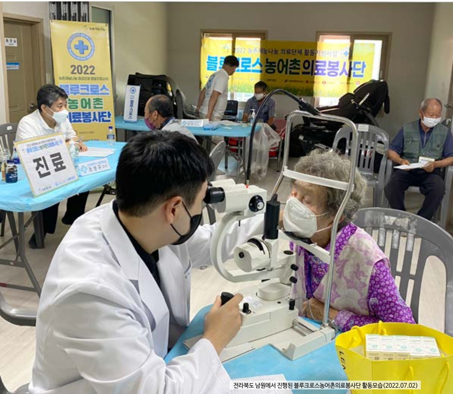
전라북도 남원에서 진행된 블루크로스농어촌의료봉사단 활동모습(2022.07.02)