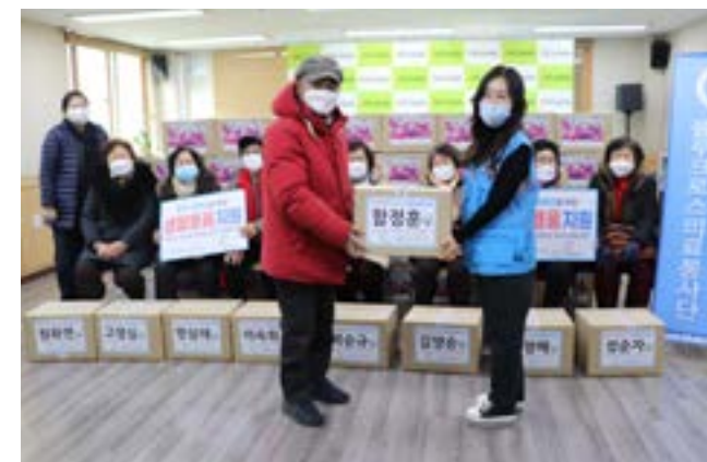
중구 취약 어르신 물품지원_나눔국민운동, 사랑의 열매(2022.01.14)