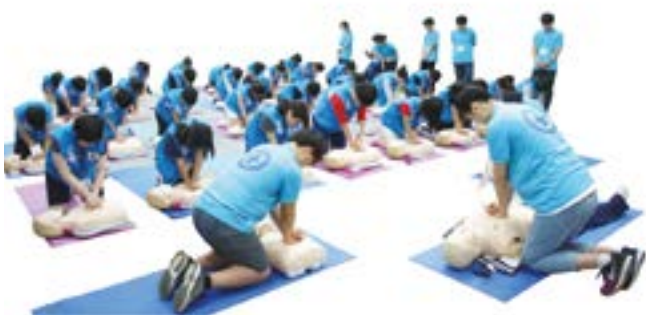
심폐소생술 국민운동 4단계 알리기 활동 모습

기간 2014년~현재까지 전국 중·고등학교 220개교, 약 5,000여 명 참여함