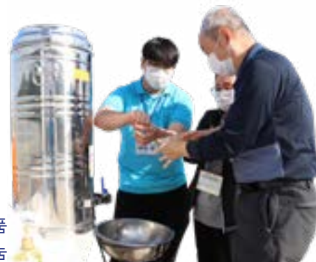
손씻기 교육 모습(2022.05.14)

※ 2020년 이후 농림축산식품부, 한국농어촌공사 재능나눔 의료단체로 연속 선정