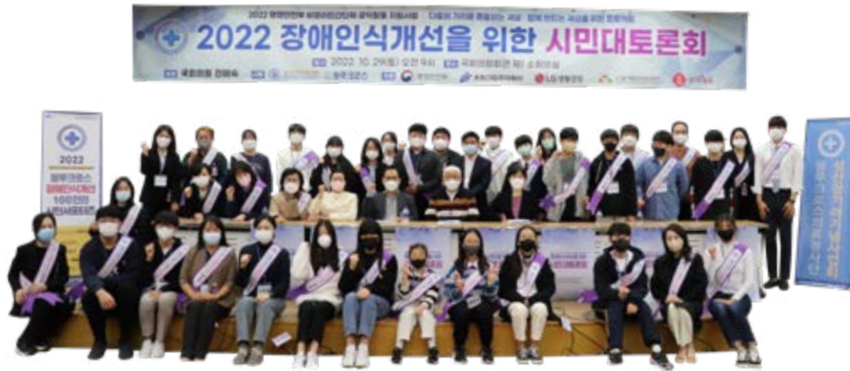
장애인식개선을 위한 시민대토론회 후 단체사진(2022.10.29)