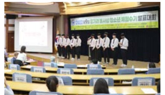
인천 송도고 동아리 SCV 발표모습(2022.08.27)