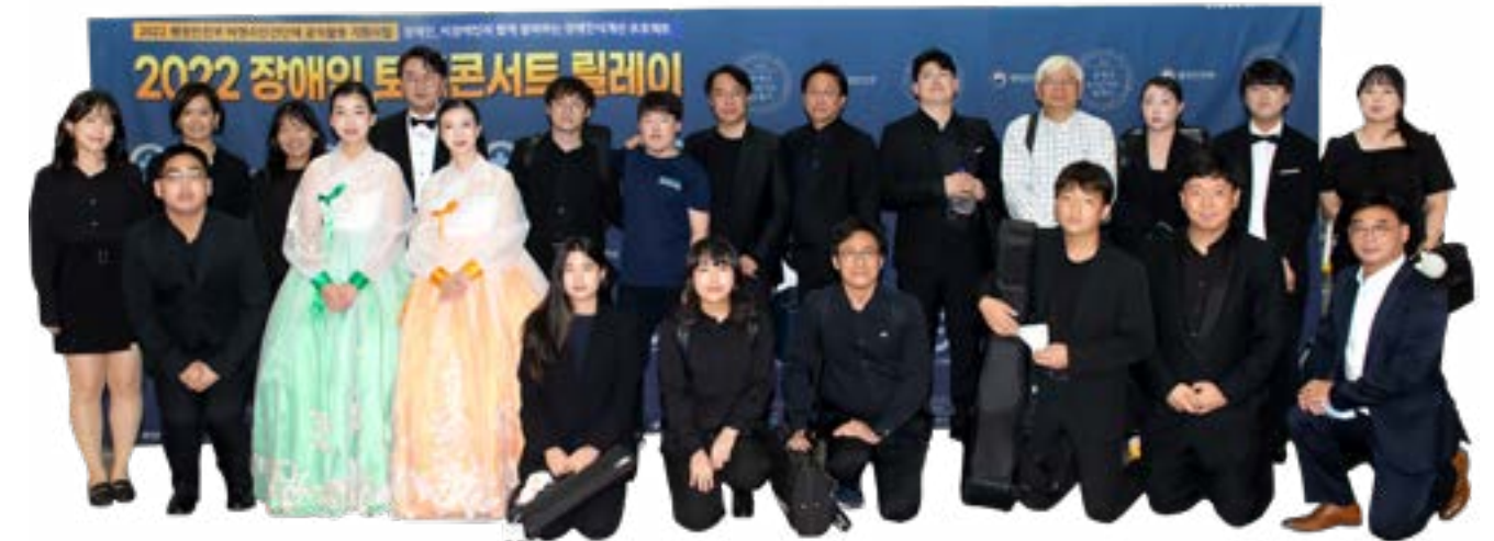
장애·비장애 연주자, 시민 연주자들이 함께 만드는 대화합의 콘서트 공연 후 단체사진(2022.10.01)