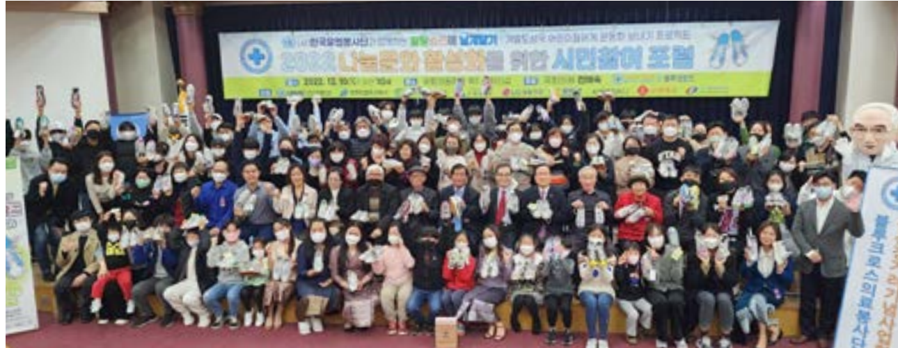
힐링슈즈에 날개달기 활동 후 시민들과 함께 한 단체사진(2022.12.10)