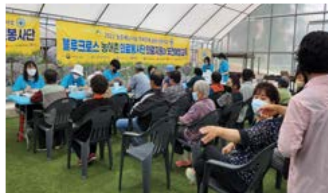
비닐하우스에서 주민들 대상으로 문진과 활력징후 검사모습(2022.08.13)