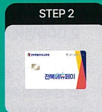
전북에듀페이 바우처카드 신청