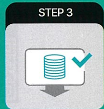
바우처 지원비 신청

(전북에듀페이 바우처카드 신청 후 바우처 지원비를 신청해야만 완료됩니다.)