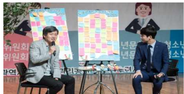
<현장 사전질문 취합 예시>