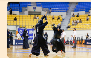
전교생 검도 교육 및 검도부 양성