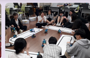
인공지능 로봇 체험활동