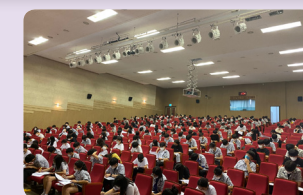
통섭형 인재양성 프로그램