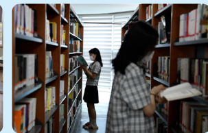
활발한 독서 생활