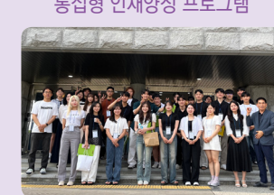
졸업생 진로 멘토링