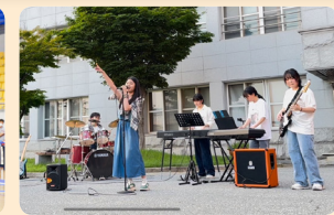
다양한 예술 동아리 활동