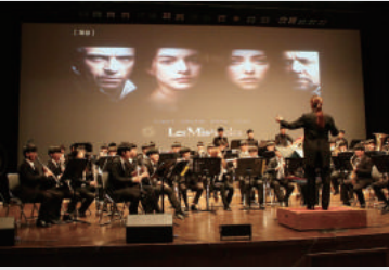
[신입생 환영 음악회]