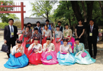
[일본 가나자와시립공고 교사 및 학생 방문]

라. 국제교류 체험학습 운영 (1) 상해시 대중공업학교 방문 및 중국문화탐방(상하이, 항주, 주가각, 학교 방문) - 기간 : 2016.10.19.~ 10.22. (2) 일본 가나자와시립공업고등학교와의 자매결연 - 2012년 10월 31일 일본 가나자와시립공업고등학교와 자매 결연식 - 2013년 한·중·일 청소년 포럼 참가를 위해 일본 가나자와시 방문(2013.10.24.~ 10.27) - 2016년 전주공업고등학교 개교 100주년 기념식 참석을 위한 일본 가나자와시립공업고등 학교 교사 및 학생 방문(2016.4.30.) - 2017년 가나자와시립공업고등학교 교류 및 일본문화탐방(교토, 오사카, 고베 기간 : 2017.10.22. ~ 10.25)