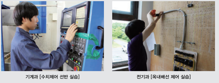
기계과 [수치제어 선반 실습] 전기과 [육내배선 제어 실습]