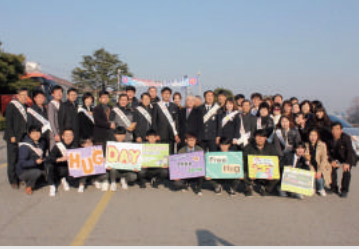
[전주공업고등학교 허그데이 행사]

마. 교육복지우수선지원사업의 운영으로 다양하고 통합적인 교육복지서비스 제공 (연간 4730만원) (1) 다양한 문화체험학습과 스포츠 활동 지원 및 교내 자체문화행사시스템 구축 (2) 교과연계 역사 테마기행, 봉사캠프, 과학교육활성화사업, 글로벌 취업 대비 외국어 능력 향상을 위한 제2외국어교실 운영 및 중국·일본문화탐방 (3) 교사·학부모와 함께하는 체험활동, 가족유대강화 프로그램, 사제 멘토링 운영을 통한 행복한 학교 만들기 정착 (4) 졸업생 선배와의 만남, 직업인 초청강의, 기업체 현장방문, 진로캠프를 통한 취업 마인드제고 (5) 지역사회와 함께하는 마을 공동체 구축, 건강지원(구강치료 지원) 사업, 외부기관과 연계한 장학금