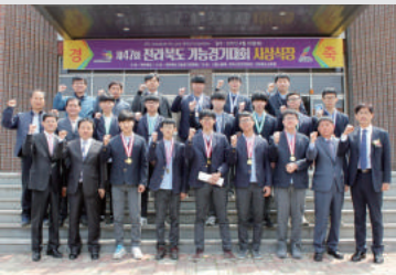
[제47회 전복 기능경기대회]

나. 다양한 특기·적성 및 동아리활동 (1) 기능 영재반 운영 - 자동차 차체수리, 자동차 정비, 목공예, CNC선반, 옥내제어, 정보기술분야, 제품디자인 - 지방 및 전국기능경기대회(2009~2017년)에서 금상31, 은상30, 동상30, 우수상13 입상, 2017년 제52회 전국기능경기대회 자동차 차체수리부문 은상, 동상, 장려상 입상, 목공예 부문 장려상 입상