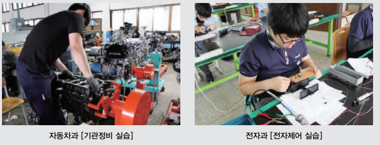
자동차과 [기관정비 실습] 전자과 [전자제어 실습]