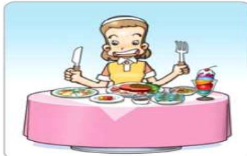
음식 먹기 전