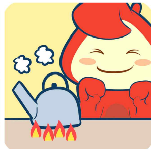
물은 끓여서 마시기