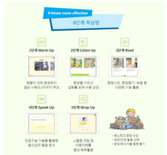
<5단계 학습법 소개>