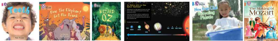
<콜린스 빅켓 시리즈 수록 도서>