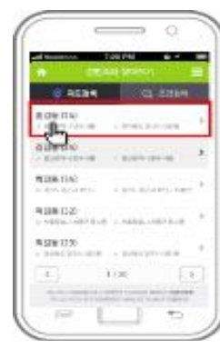
④ 성범죄자 확인