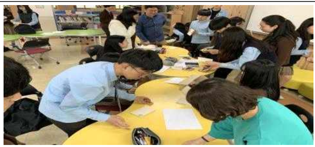
전통오침제본으로 책 만들기 활동