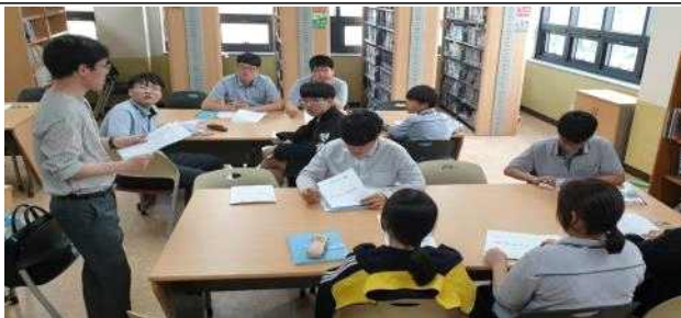
사서 진로, 도서관과 책의 역사, 분류와 정리하기 교육