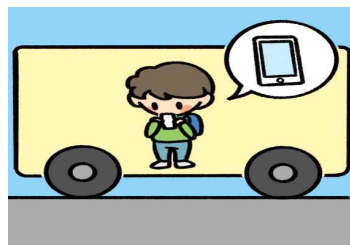
(대중교통)버스에 서 있을 때 휴대폰을 사용하지 않아요.