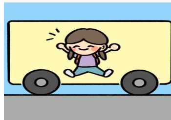
버스 안에서 장난치거나 돌아다니지 않아요.