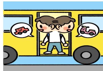
좌우를 살펴보고 다른 차량이나 오토바이가 없는 것을 확인하고 내려요.