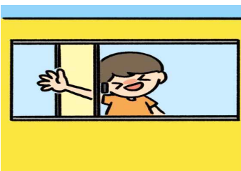
차창 밖으로 손이나 머리, 물건을 내밀지 않아요.