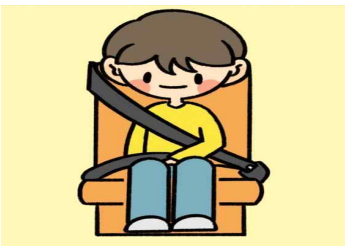
출발 전 안전띠를 착용해요.