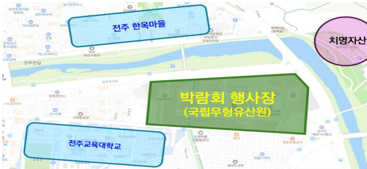
< 행사장 위치 (전북 전주시 완산구 서학로 95) >