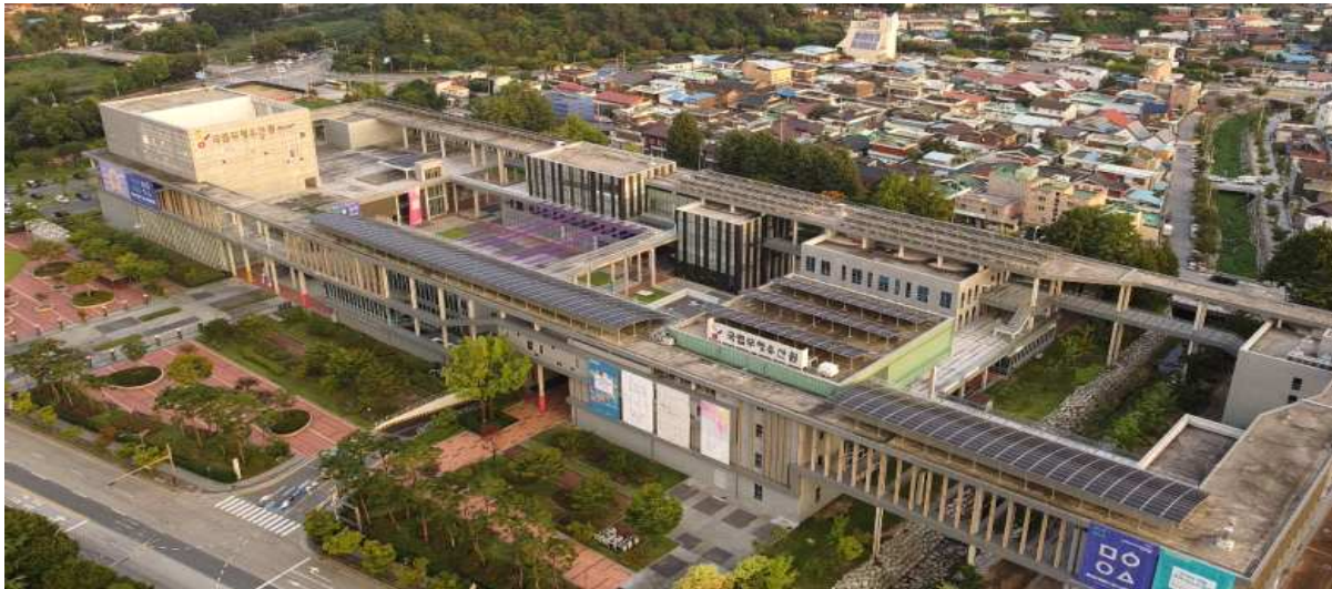
< 행사장 전경 >