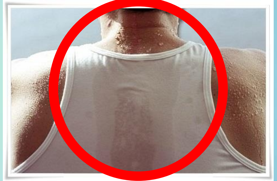
2. 땀에 젖은 옷