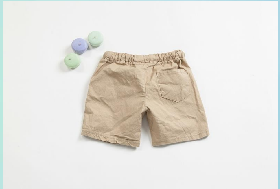
2. 깨끗한 바지