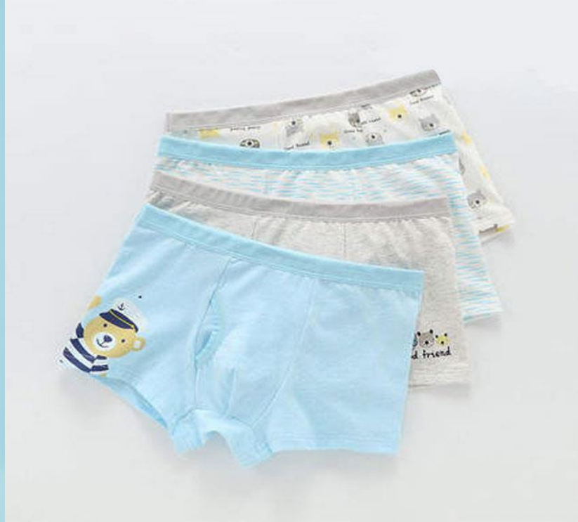
1. 깨끗한 속옷