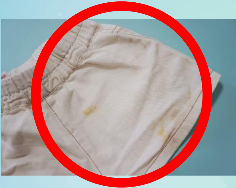
1. 얼룩이 묻은 바지