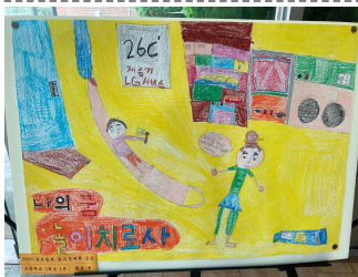
고등 3학년 1반 황보영