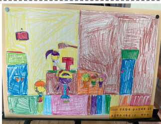
초등 6학년 박수연