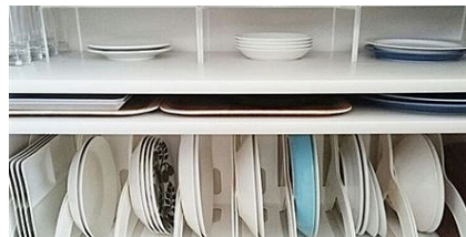
▲ 종류와 크기별로 그릇을 정리해요