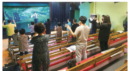
▲ 다양한 공연을 관람하고 실력을 키워요