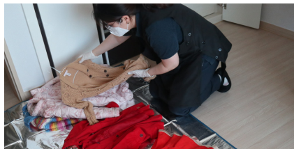
▲ 계절과 색상에 따라 옷장을 정리해요