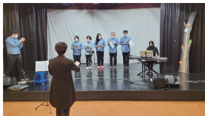
▲ 열심히 공연 준비를 하며 실력을 뽐내요