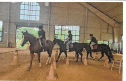
스트레스 회복 프로그램