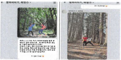
소근 소근 옛길 걷기