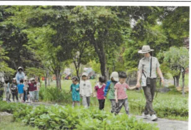
우리는 자연 꿈틀이