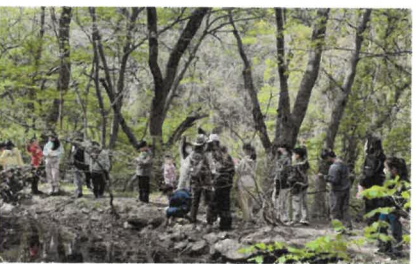
뽀뽀(Fun Fun)한 국립공원 진로여행