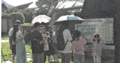
지구(구)해서 지켜 내장!