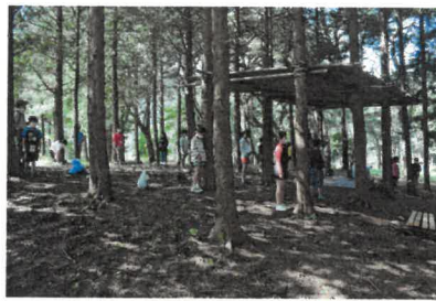
내장산 단풍 속 감성여행