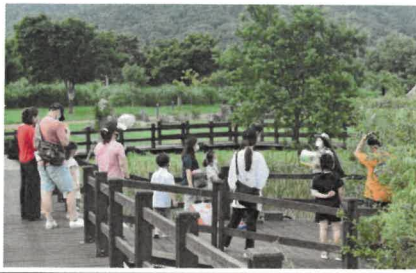
사람이 자연 되는 내장호 트레킹