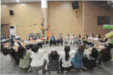
내장산 생태·환경교육 연수