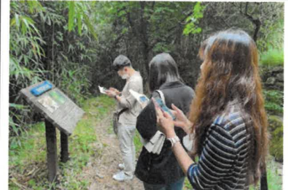
노랑이와 내탐이의 슬기로운 탐방생활