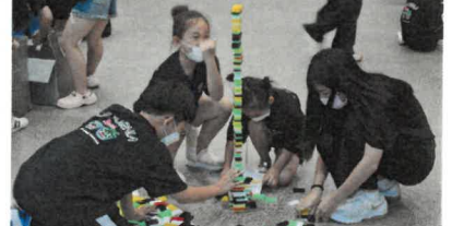
내장산과 함께하는 즐거운 여행