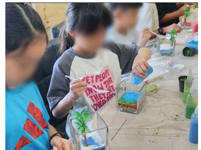
색모레테라리움을 이용한 원예심리 수업(여름표현)