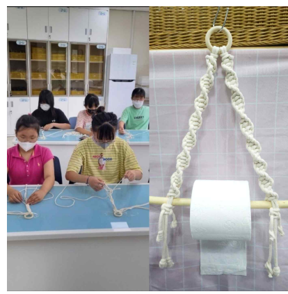
입암초 마크라메휴지걸이 만드는 모습