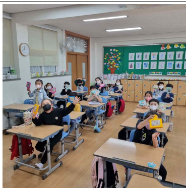
1학년친구들 어버이날선물 타일냄비받침 완성후