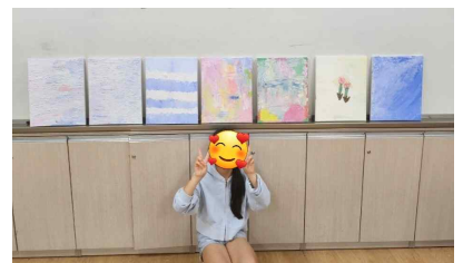
내가 만든 백드롭 페인팅 앞에서 기념촬영