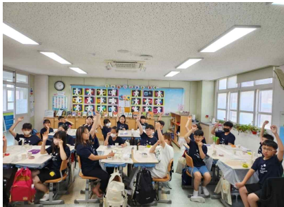
북초등학교 탄소중립 설거지비누 만들기 발표모습