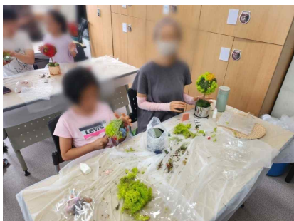
천연이끼화분 만들기 모습 수업 (모스토피어리)