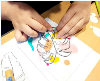
글라스아트 무드등 납선으로 라인 표현 중