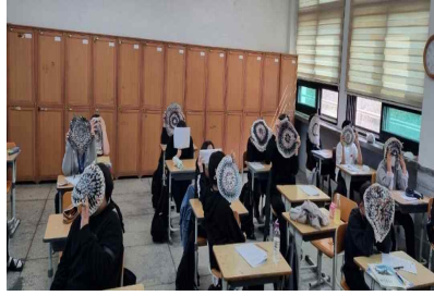
자유학기제 양말목 방석 수업후