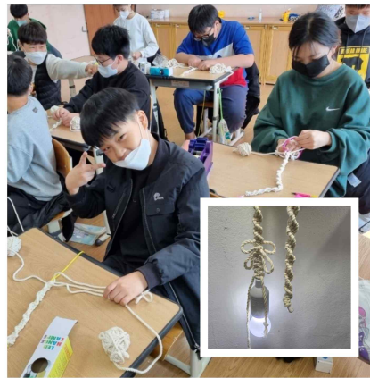
보성초등학교 마크라메 전등만들기