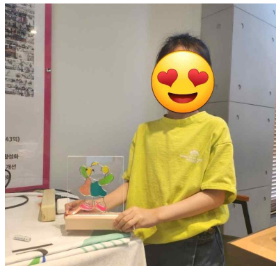
글라스아트무드등 완성한 친구 사진