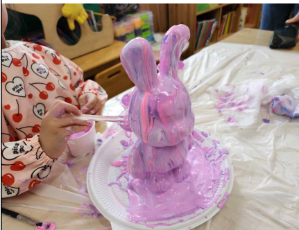
병설유치유치원 푸어링아트 토끼저금통만드는 모습