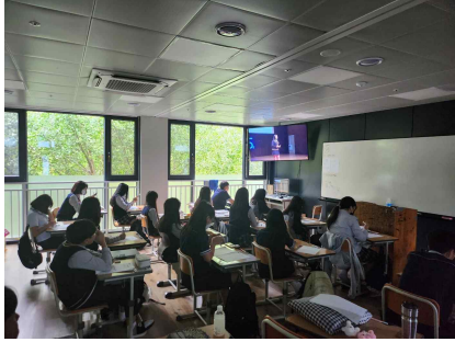
자유학기제 지속가능발전에 대한 시청