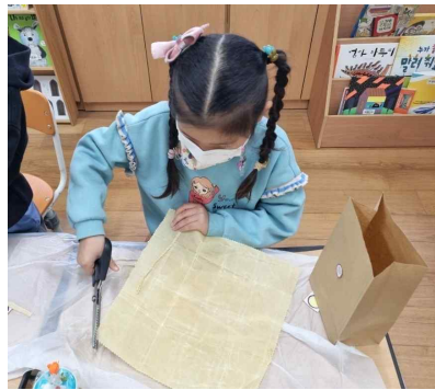
제로웨이스트밀랍랩만들기 1학년-컷팅 하는 모습